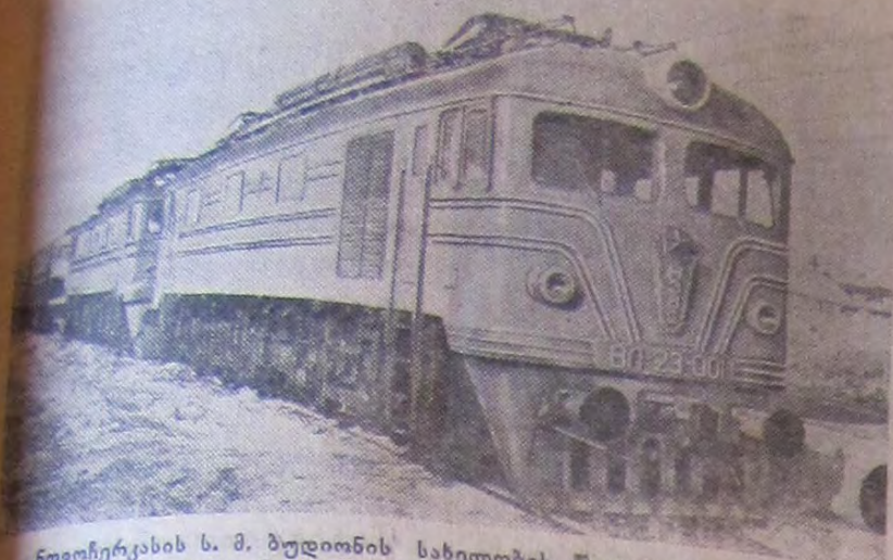
ნოვოჩერქასის ს. მ. ბუდიონის სახელობის ელექტრომავალი მშენებელთა სახელობის საავტომობილო სატვირთო ელექტრომავალი „ვლ-23“. მისი სიმაღლე 4.300 ცხენისძალას უდრის, რაც 30 პროცენტით აღემატება ხერხის ელექტრომავალ „ვლ-22“-ს. ახალი ელექტრომავლის ტვირთწოდობის ძალა 70 კილომეტრსა და 1,7-ჯერ ორჯელმავალ „ვლ-22“-ს. „ვლ-23“-ის მაქსიმალური სიჩქარე 100 კილომეტრ-საათს უდრის სურათზე: ელექტრომავალი „ვლ-23“.

აგიტაციური მუშაობის წინაშე განსაკუთრებით სერიოზული ამოცანები დგას ახლა, როდესაც მთელს ჩვენს ქვეყანაში ფართო მასშტაბით მიმდინარეობს პარტიის XX ყრილობის მასალების გაცნობა მშრომელ მოსახლეობაში. პარტიისა და მთავრობის მიერ სოფლის მეურნეობის წინაშე დასახული ამოცანების განხორციელებისათვის ბრძოლაში რაიონის ბევრმა პირველადმა პარტიულმა ორგანიზაციამ მნიშვნელოვნად გააუმჯობესა პარტიულ-პოლიტიკური და პარტიულ-ორგანიზაციული მუშაობა. აგიტაციური მუშაობის გააქტიურება მართავენ საუბრებს პარტიისა და მთავრობის გადაწყვეტილებათა შესახებ, მიმდინარე პოლიტიკის უმნიშვნელოვანეს საკითხებზე, ეწევიან სოფლის მეურნეობის მოწინავეთა გამოცდილების ფართო პროპაგანდას.