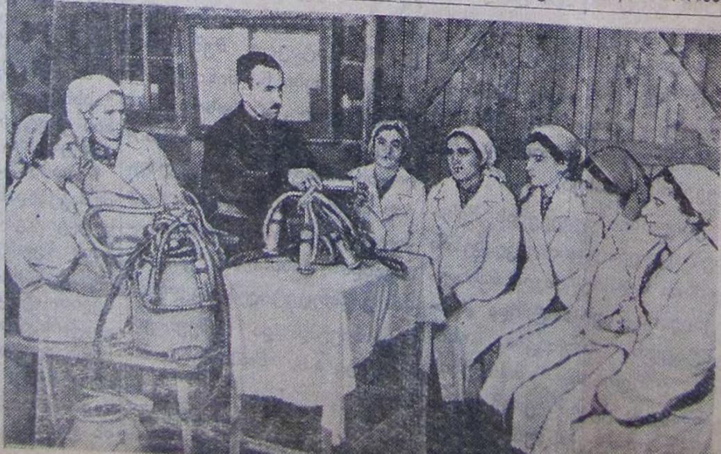
წვალტუბოს რაიონის სოფელ გვიშტიბის კავანოვის სახელობის კოლმეურნეობის მეცხოველეობის ფერმა ერთ-ერთი მოწინავე რესპუბლიკაში. აქ აშენებულია ორი ბოსელი, რომლებშიც მოწვობილია ავტომატური სარწყულებლები, მთლიანად მექანიზირებულია შრომატევადი სამუშაოები, რაც უზრუნველყოფს კოლმეურნეთა შრომის შემსუბუქებას.

სურათზე: პრაქტიკულად მეცადონებმა მწველავებთან კოლმეურნეობას მექანიზებული ფერმა